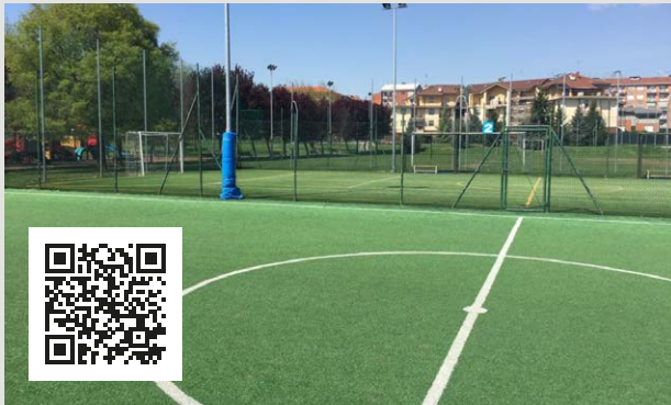
Centro Sportivo San Silvestro - Chieri (TO)