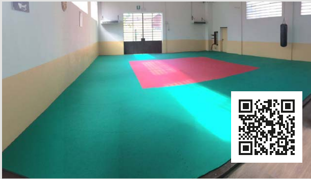
FudoYama Aikido - Via Quarino, 6 - Chieri (TO)